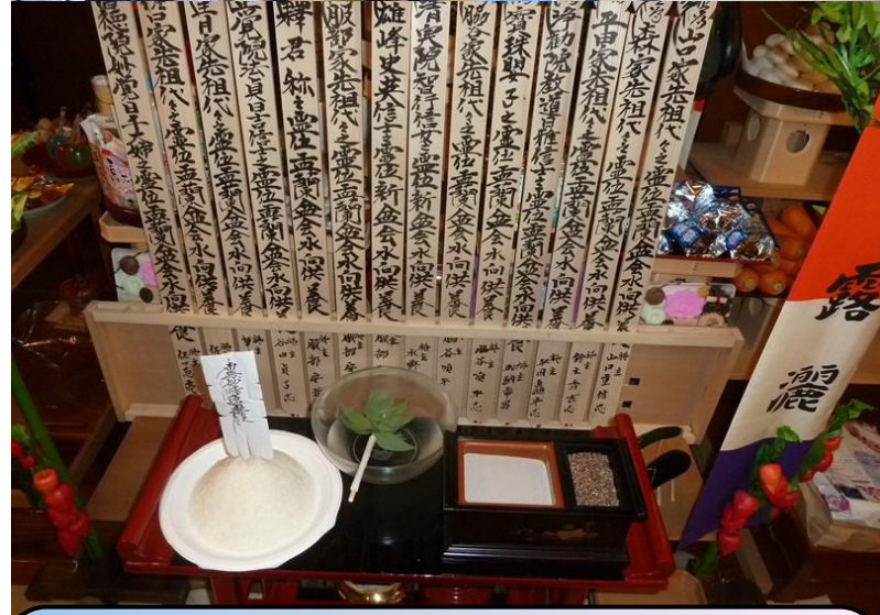
ご先祖様へ水をさし お題目旗を立てていきます