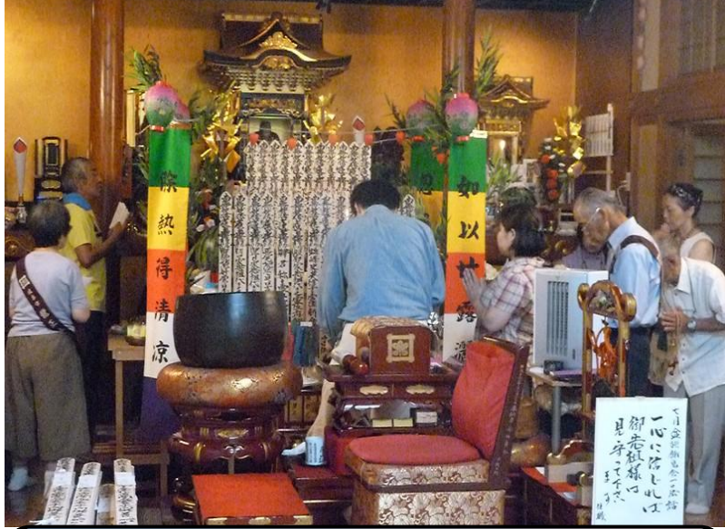
新盆・特別供養申込みの方による行道