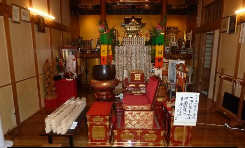
仏様の準備も整い御先祖様を迎えることが出来ました