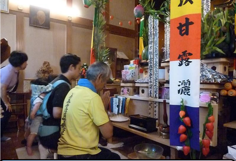
親子三代揃っての先祖供養