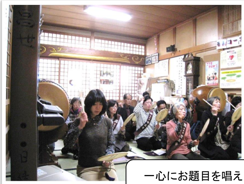
一心にお題目を唱え 先祖供養…