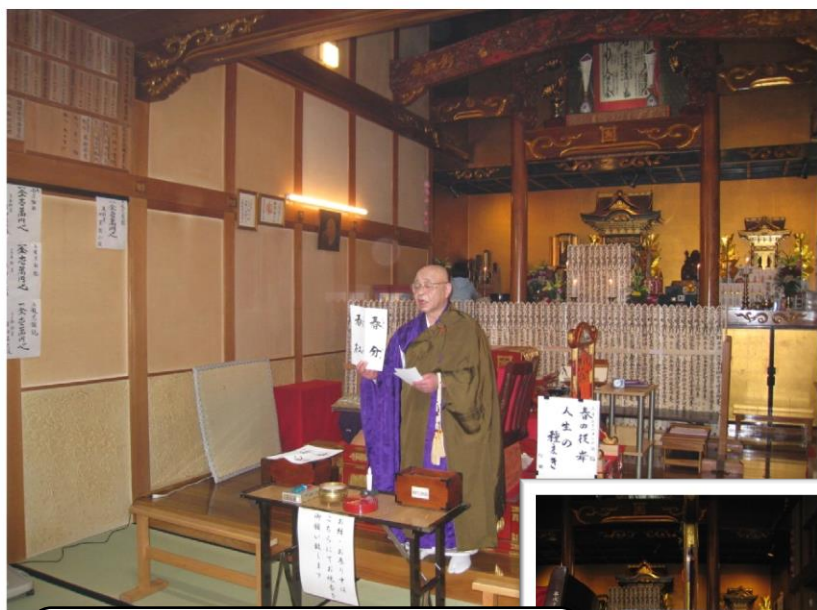
ご先祖の供養を子孫に伝えよう