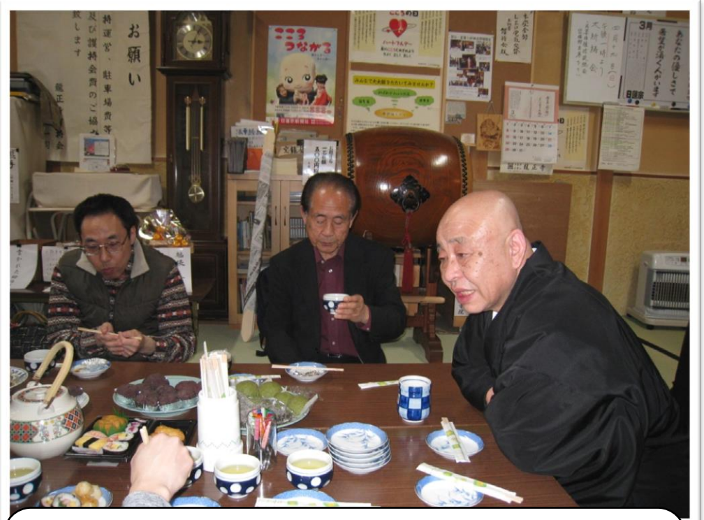
住職とともに先祖供養について語り合いました。 おいしいぼた餅をいただきました。