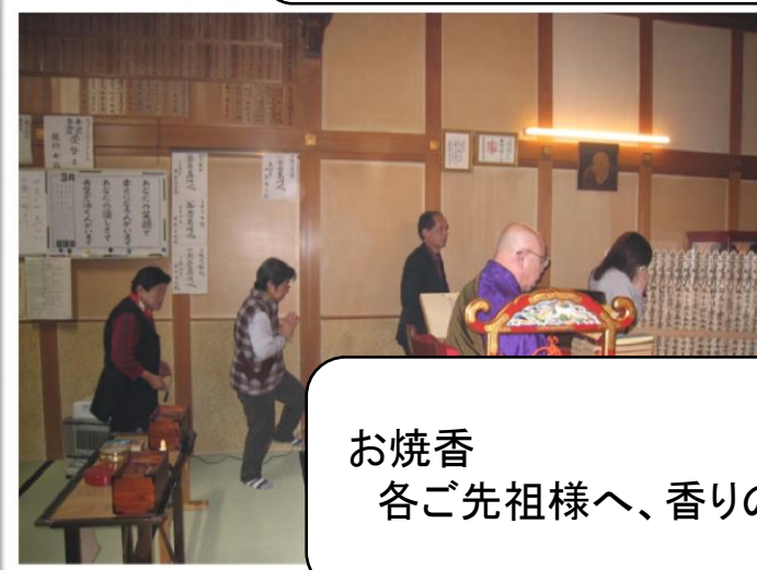
お焼香 各ご先祖様へ、香りのお供え…