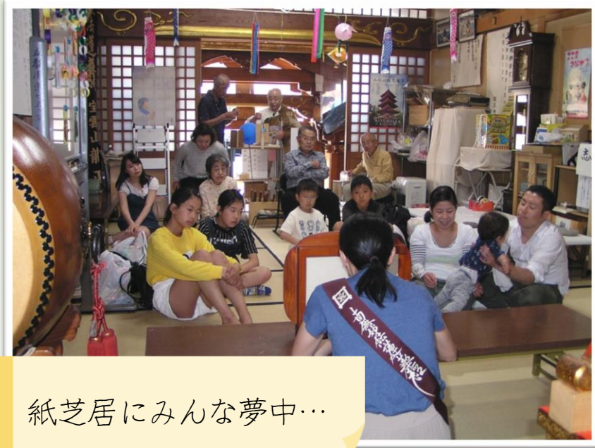
紙芝居にみんな夢中…