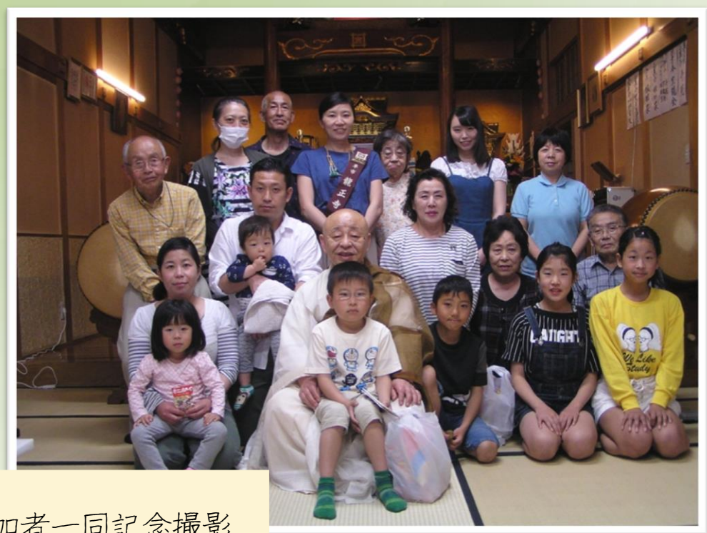
参加者一同記念撮影