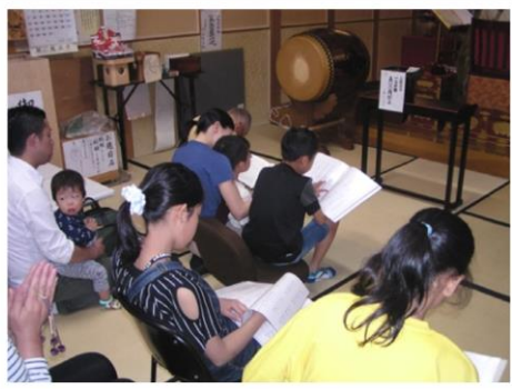
平がなのお経本を読みました