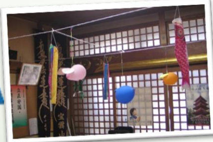
龍正寺には鯉のぼりがいっぱい