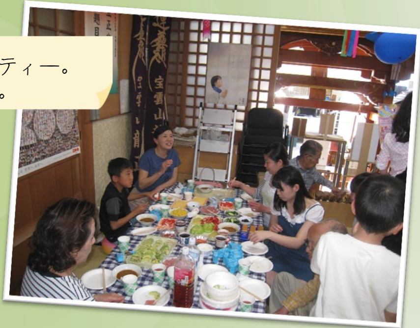
みんなでパーティー。 楽しかったよ。