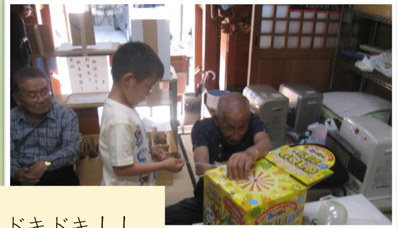
何が出るかな？ドキドキ！！