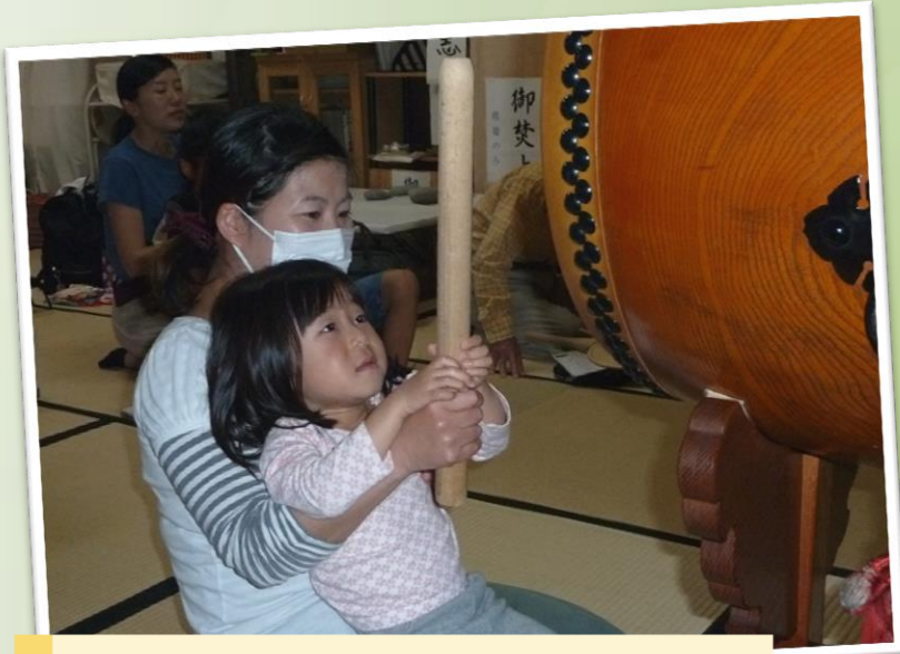
ママと一緒に太鼓をたたいたヨ