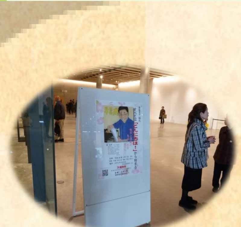
メディアコスモス内の案内看板