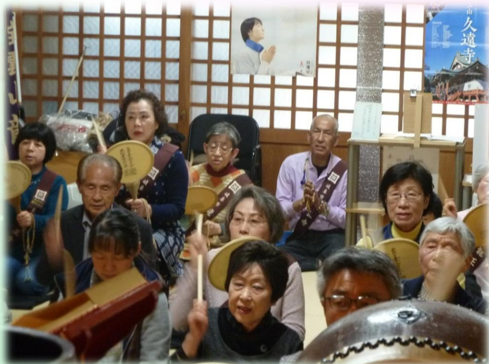
うちわ太鼓で精一杯御題目を唱えます…