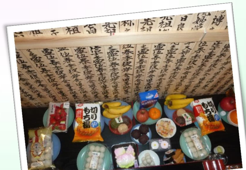
たくさんのお供えが上がりました