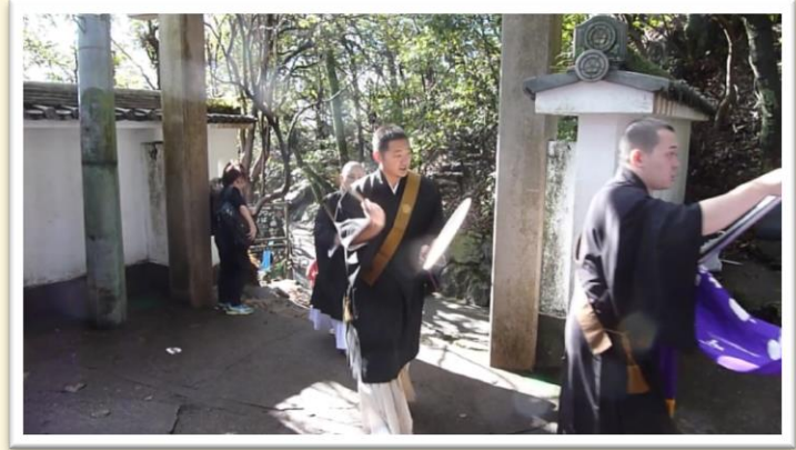
岐阜県日蓮宗青年会による唱題業。 金華山にお題目が響き渡りました。