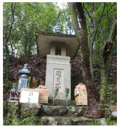
今年もお題目塚供養に参加させて頂きました。