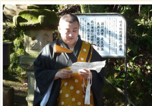
傍島岐阜県宗務所長の挨拶