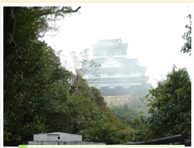
霧がかかっていた岐阜城 ですが...