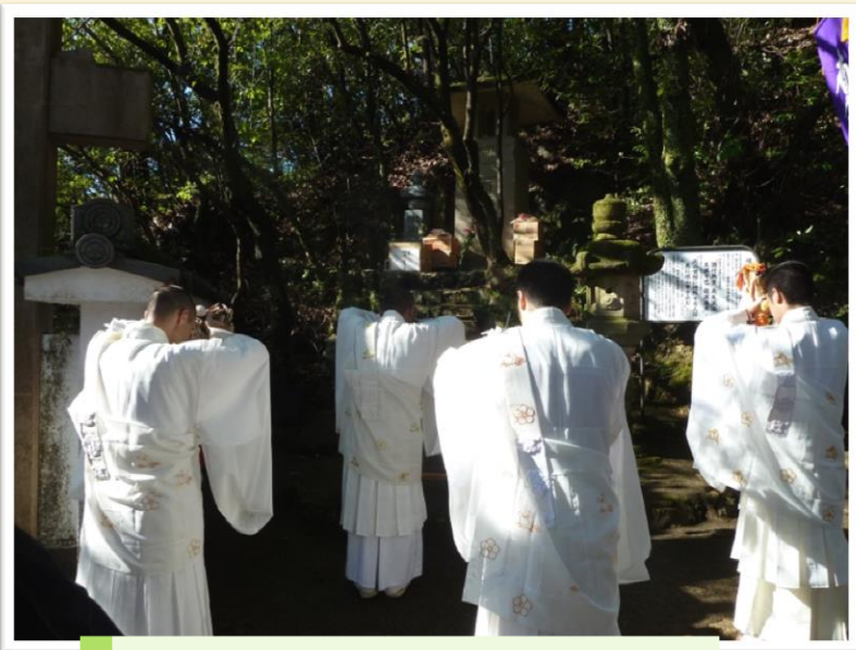
ご祈祷の様子です