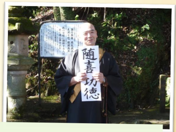
天田布教師会会長の法話