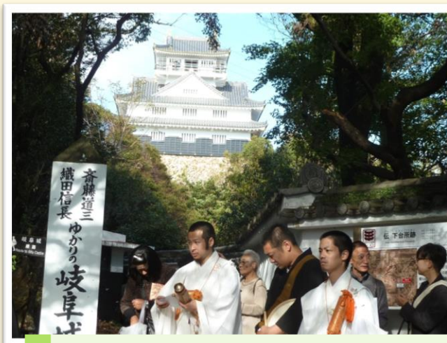
法要が終わる頃には はっきり見える位晴れ間が広がりました