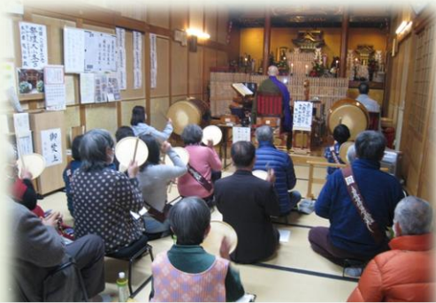
疫病へのお経、皆で太鼓一心に叩き、感応道交（かのうどうきょう）し、太鼓の音が一つになっていました