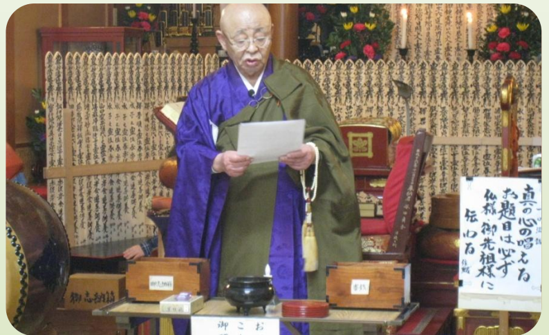
『真の心の唱える御題目は必ず仏様・ご先祖様に伝わる』の法語をいただいています。