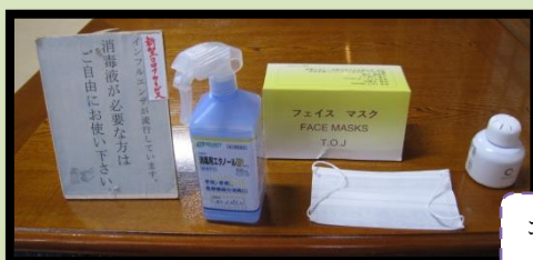
コロナ対策し、法要を行いました