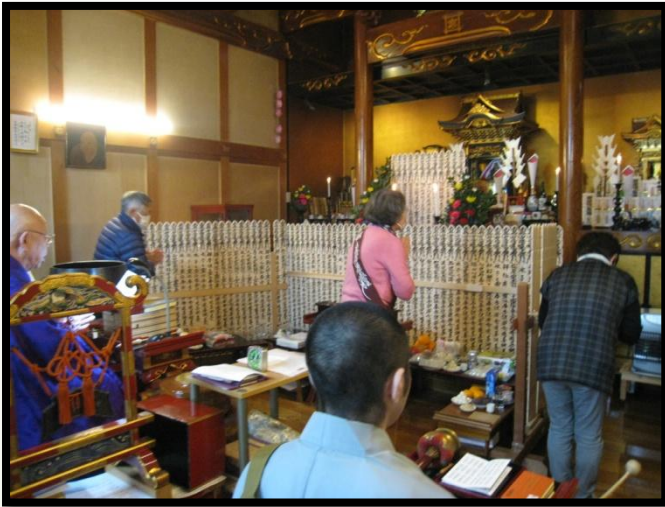
各々が先祖の塔婆前で手を合わせて礼拝しています