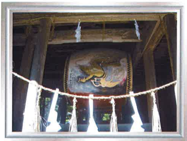
諏訪大社 上社 鳥居