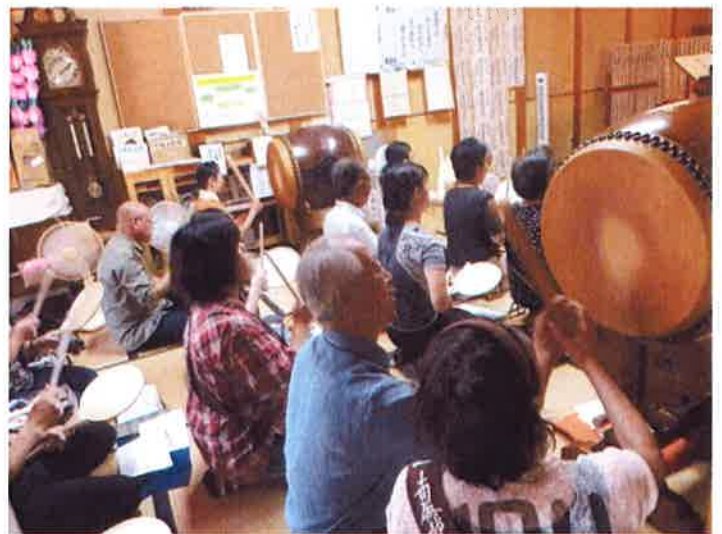
親子で心をこめて 太鼓を叩きます