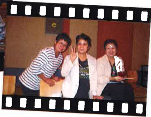
たくさんの笑顔に 思わず・・・パチリ