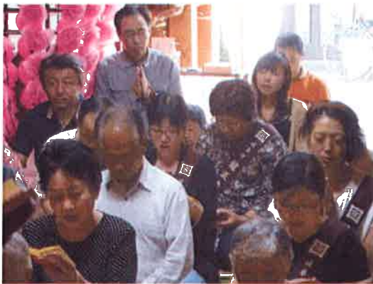
読経中・・・ それぞれの思いを込めて・・・

法話を聞き改めて、彼岸の大切さそして彼岸をむかえ、送る私達の心に御先祖への『感謝の心』が芽生えました。