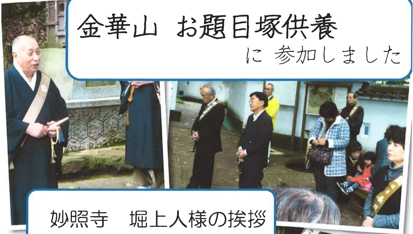
妙照寺 堀上人様の挨拶