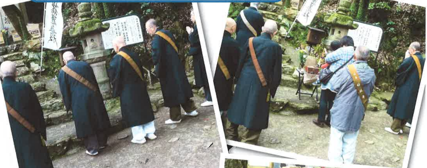
今年は信長公も参加 されました