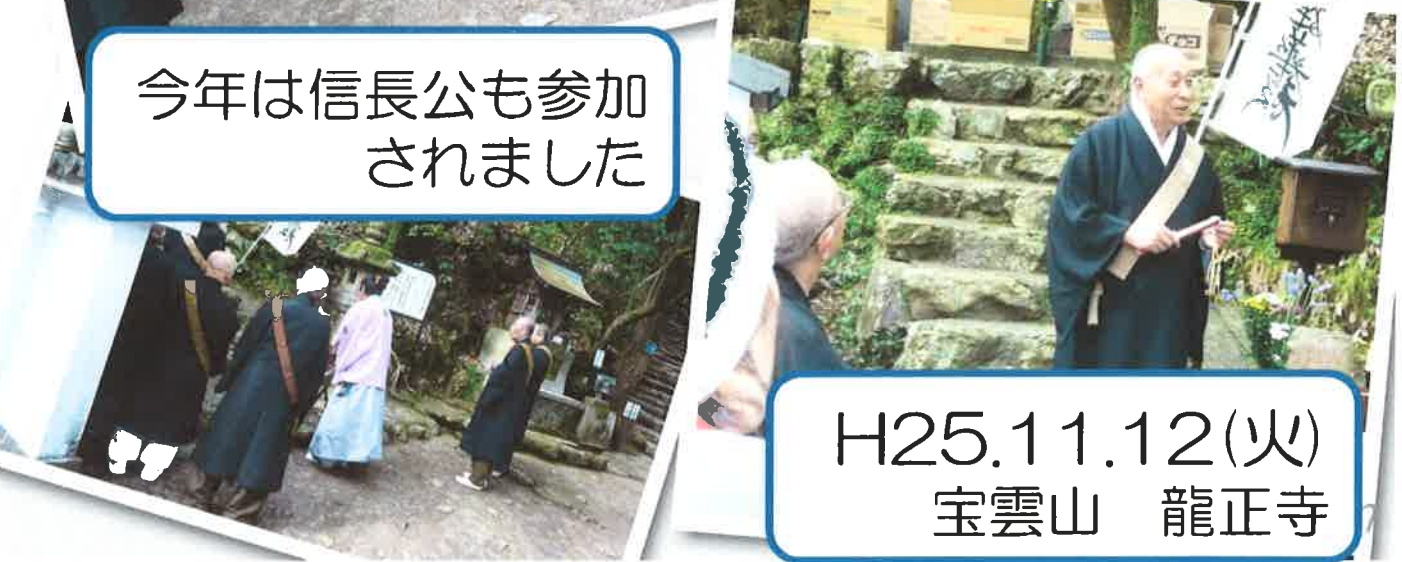
H25.11.12(火) 宝雲山 龍正寺