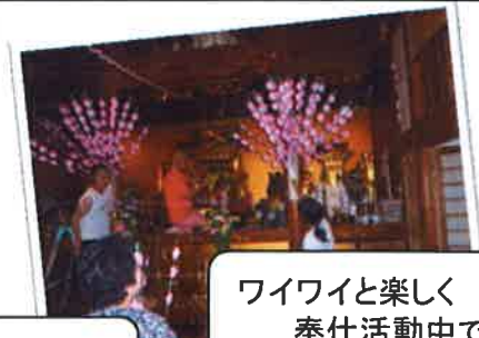
ワイワイと楽しく奉仕活動中です