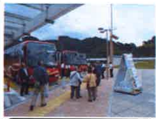
バス3台、130名の参加となりました