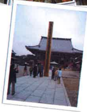
力道山のお墓の見学