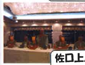
佐口上人の乾杯のあいさつ