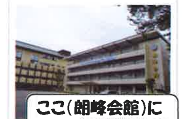
ここ(朗峰会館)に泊まりました