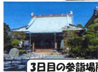
3日目の参詣場所 海長寺