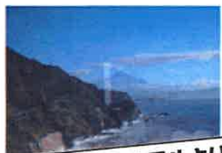
台風一過！ホテルより眺めた富士山です