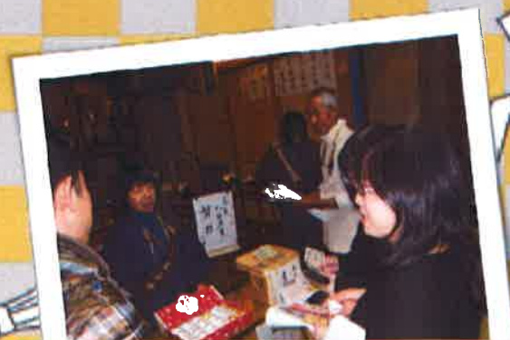
今年のおみくじは何かな～?