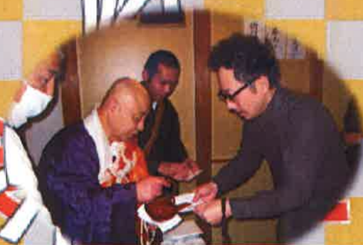
御住職からお屠蘇を戴きます。 もろろんノンアルコールです。