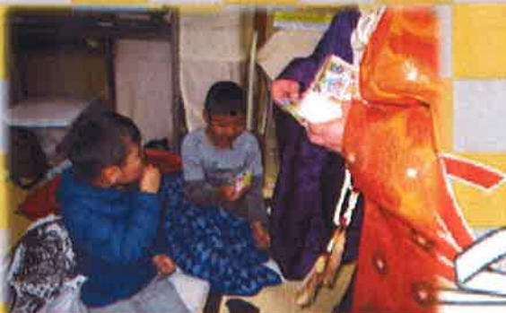
やったぁ～お年玉ありがとうございます!!