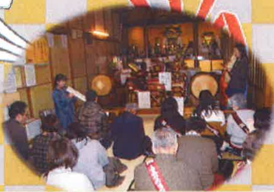
檀信徒の皆さんと一緒に一月一日の歌を歌いました。