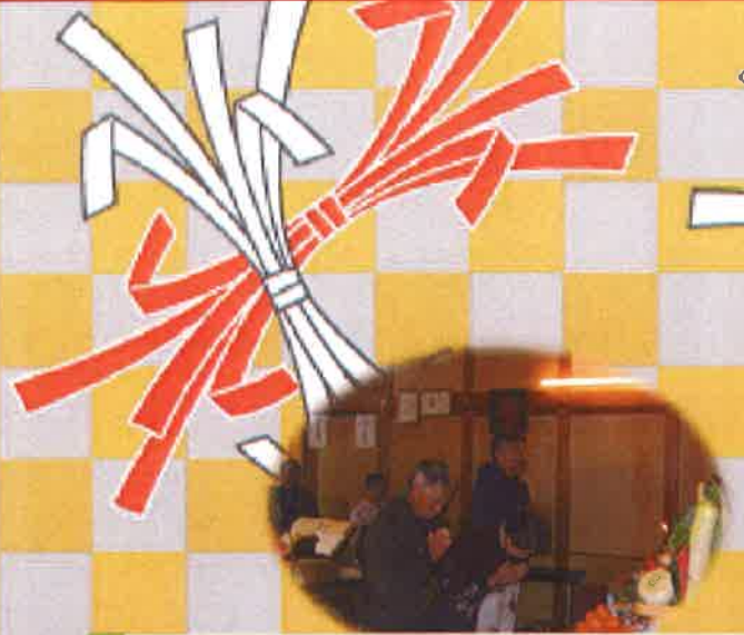
良い年でありますように…祈ります。